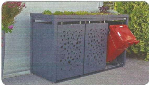
Modell TOMO – für 3x120L Mülltonnen Farbe: RAL 7016