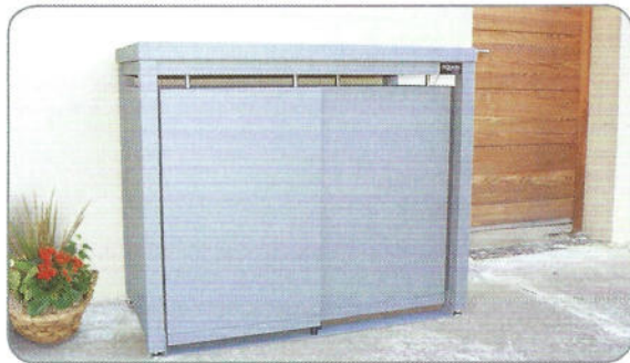
Modell BLANK – für 2x120L Mülltonnen Farbe: RAL 7040