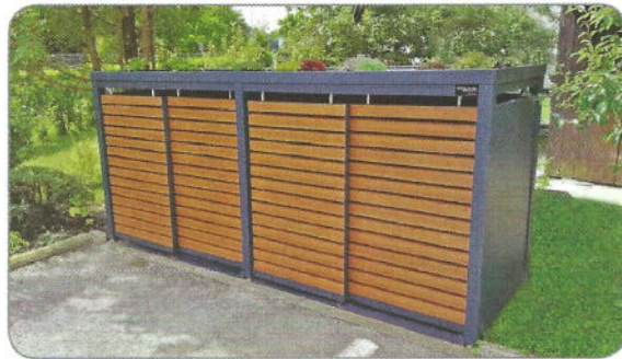
Modell LINIS – für 4x240L Mülltonnen Aluminiumleiste: Holzimitat Kirschbaum hell