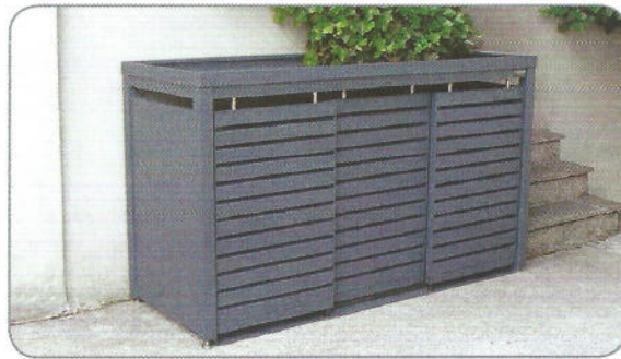
Modell LINIS – für 3x120L Mülltonnen Farbe: RAL 7016