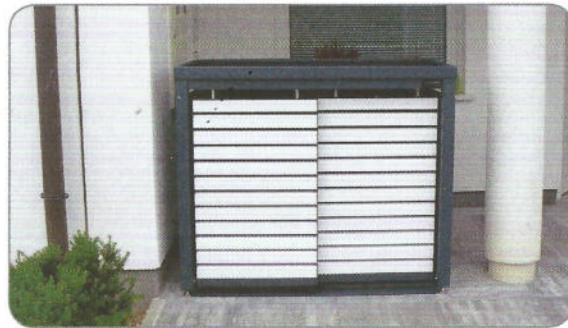
Modell LINIS – für 2x120L Mülltonnen Aluminiumleiste: RAL 9003