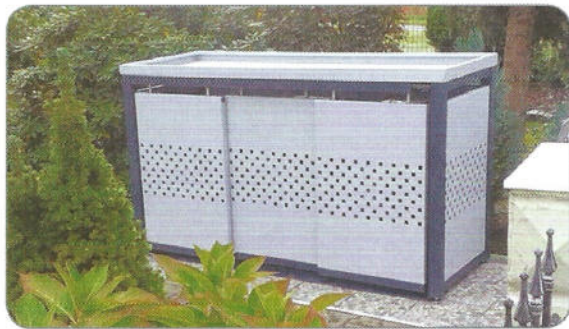
Modell QUBIS – für 3x120L Mülltonnen Farben: RAL 7016 und RAL 9006