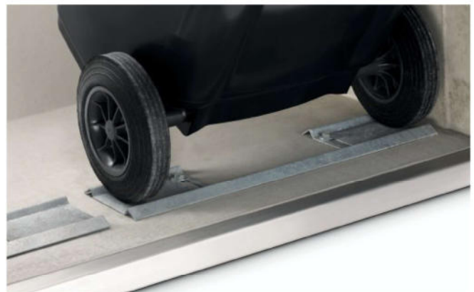
Kipprahmen bzw. Bodenaussparung Sichere Räderarretierung für 120-l- bzw. 240-l-Behälter.