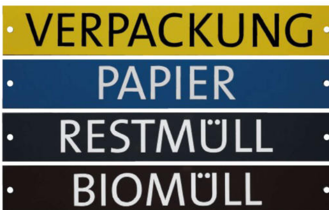
Austauschbare Fraktionskennzeichnung in Fraktionsfarbe Fraktionsschild montiert auf der Stirnfläche in Augenhöhe, befestigt mit Spezialschrauben.