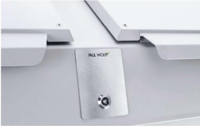
Dreikant-Schloss für Öffnungsklappe Edelstahl-Dreikant-Schloss für die Öffnungsklappe.