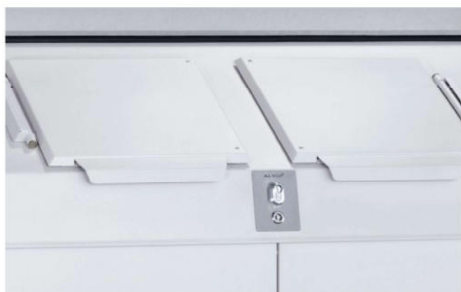
Zwei 40-l-Öffnungen mit Deckel