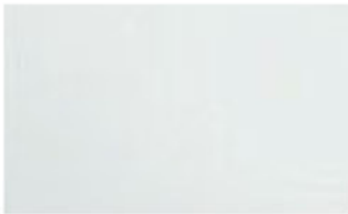
Weißaluminium (RAL 9006), Feinstruktur, matt

Die glatten Fronten werden im sogenannten Duplexsystem nach EN 1090 pulverbeschichtet. Dabei wird lösemittelfreies Pulver eingesetzt, eine ausgesprochen umweltfreundliche Art der Farbgestaltung.