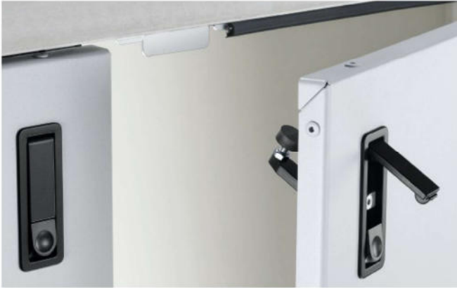
Klapphebel Zum Schließen der Türen.