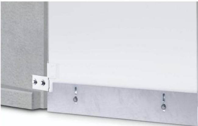
Einstellbares Bodenabschlussblech Aus Stahl, verzinkt nach DIN EN ISO 1461.