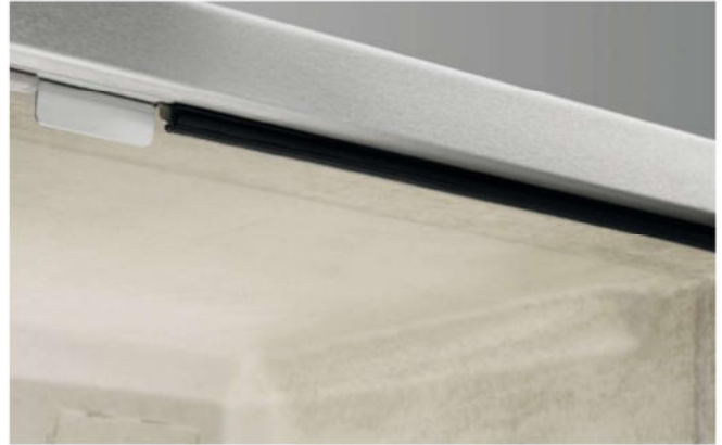
Gummidichtung für Türanschlag Ermöglicht leises Schließen der Türen.