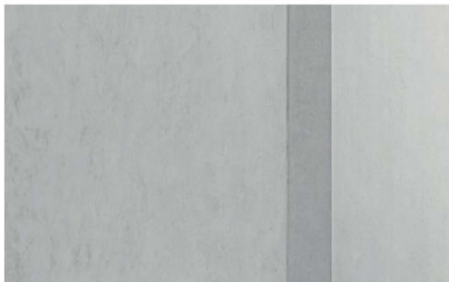
Rahmenloser Korpus aus Betonwerkstein