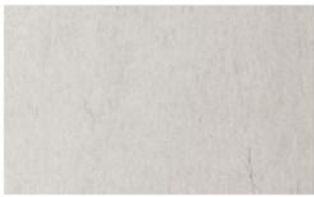
Basisgrau, Sichtbeton, glatt

Die Seitenwände und das Dach haben schalungsglatte Sichtbetonflächen; die Einfüllseite ist dabei von Hand abgezogen und geglättet. Die hellgraue Färbung des glatten Sichtbetons wird durch den eingesetzten Zement gesteuert.