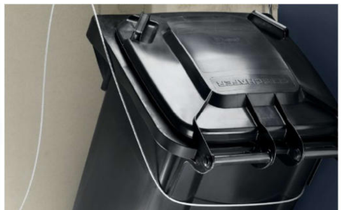
Fangschlaufe(n) Zur komfortablen Bedienung von 2-Rad-Behältern.