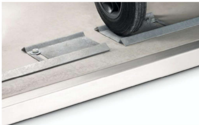
Bodenwinkel aus Edelstahl Dienen als unempfindlicher Anfahrtschutz.