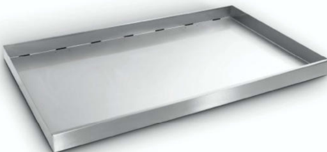
Pflanzwanne aus Edelstahl Ermöglicht eine Begrünung des Daches.