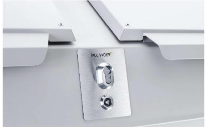
Schloss für Deckel, vorbereitet für Halbzylinder 10/30 Verriegelt selbstständig die Einwurfdeckel und verhindert damit Fremdeinwurf.